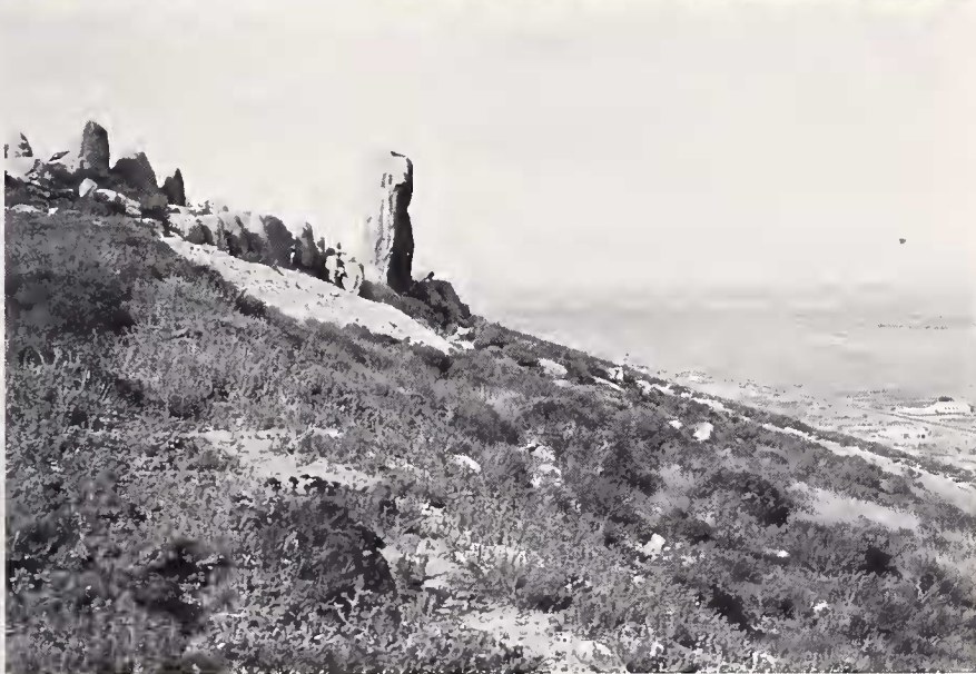
Abb. 4: a) Der Westhang des von Scelotes gronovii besiedelten Hügels bei Saldanha Bay, Kapprovinz. b) Der felsenreiche östliche Teil des Hügels wird von Cordylus p. polyzonus sowie Geckonen und Mabuyen bewohnt.